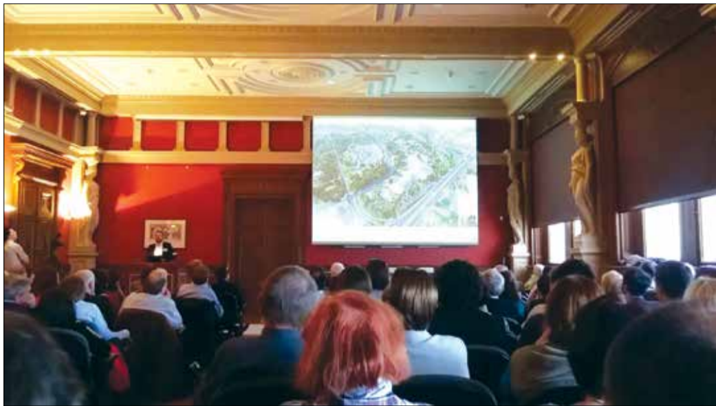
A konferencián az építész és urbanisztikai szakma képviselői mondták el véleményüket a projektről

amelyet a Magyar Urbanisztikai Társaság által az MTA székházában rendezett konferencia résztvevői 2015. április 17-én egyhangúlag elfogadtak.