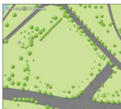
Terv szerinti fakivágás