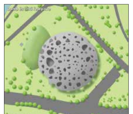
Domb és tető felépítve