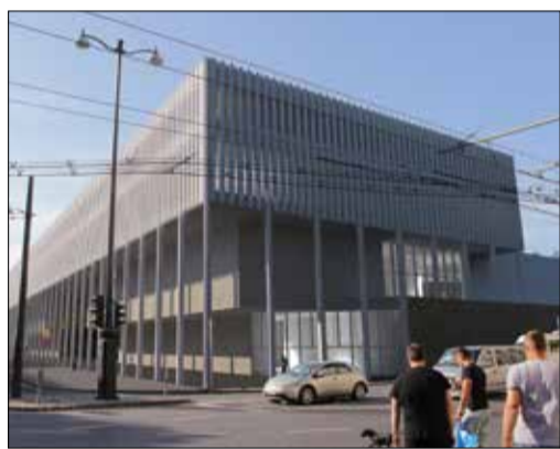
A „radiátorház” a liget Dózsa György úti bejáratát zárná le