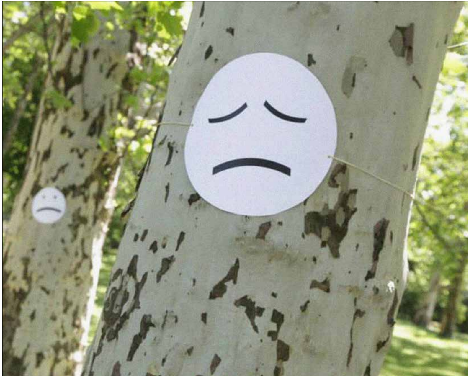
Évszázados platánfák is elpusztulhatnak a tervezett beépítések miatt

Mindannyiunk érdeke, hogy a Városliget megújuljon végre, kikapcsolódást, a pihenést tudja szolgálni továbbra is. De tisztázni kellene a fogalmakat: a parkfejlesztés (park felújítás, parképítés stb.) nem egyenlő az ingatlanfejlesztéssel (épületek építése, magas és mélyépítés, utak, hidak stb.). Az egyikben növényekkel, zölddel foglalkozunk, a másikban betonnal – nagyon leegyszerűsítve.