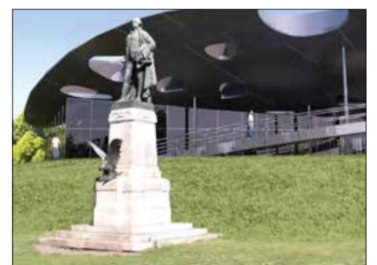
A Magyar Zene Háza a Washington szobor felől