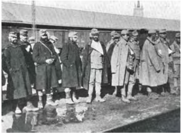
Sebesültek elszállításra várnak

néhány napra elfoglalniuk. A Monarchia csapatai a várostól délre foglalták el védelmi állásaikat, majd onnan kiindulva ellentámadásba kezdtek, és kemény harcok árán 1914. december 9-én felszabadították Bártfát és környékét. Ezt követően sikeresen átkeltek a Kárpátok északi oldalára, és a limanowa–tapanóvi csatában hozzájárultak az osztrák–magyar csapatok győzelméhez.