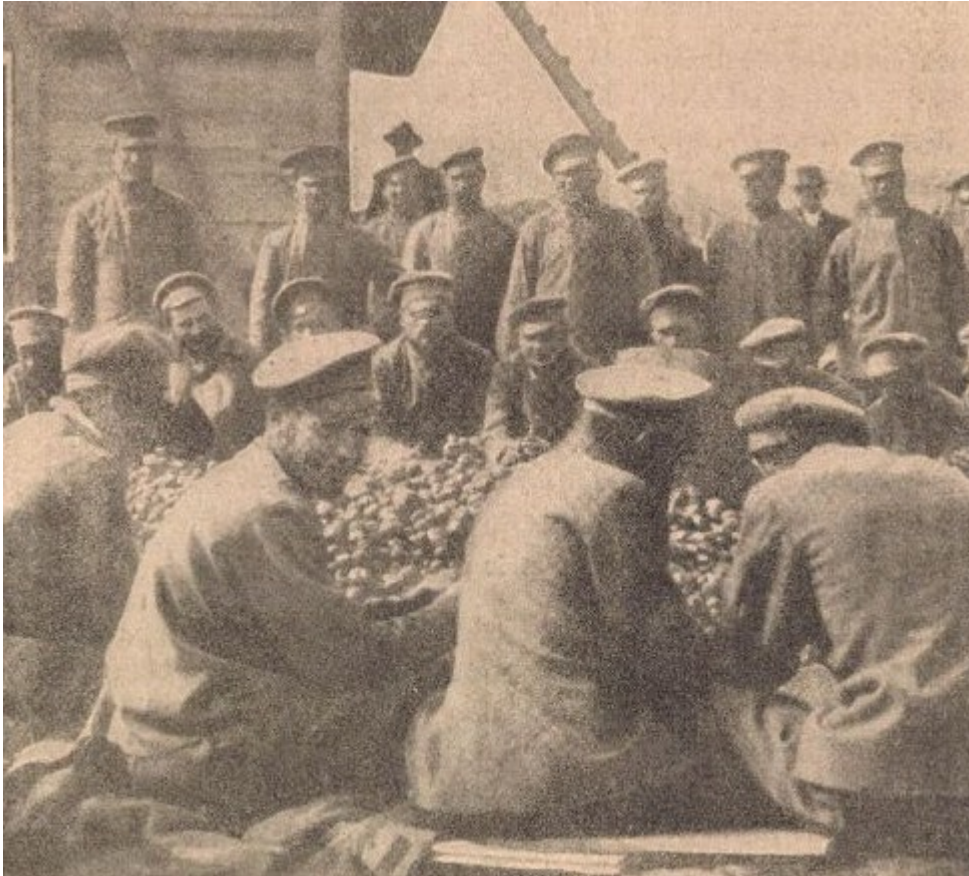
Burgonyát hámozó orosz hadifoglyok Kenyérmezőn

foglalatoskodnak, másutt asztalosok, ácsok, lakatosok, bádgosok fűrjék, faragják, esztergályozzák városuk szükséges tárgyait, cipészek, szabók a sok orosznak való csizrát, köpenyt készítenek. Borbélyműhelyeik vannak, sőt olvasótermük s iskolájuk is; templomuk, külön fürdőépületeik, fertőtlenítő barakkok. [...] Tűzoltó szervezetük is van. Tolólétrákkal, szivattyúkkal gyakorlatoznak. Minden reggel istentiszteletet tart számukra egy Bukovinából idekerült rutén pap. " 28