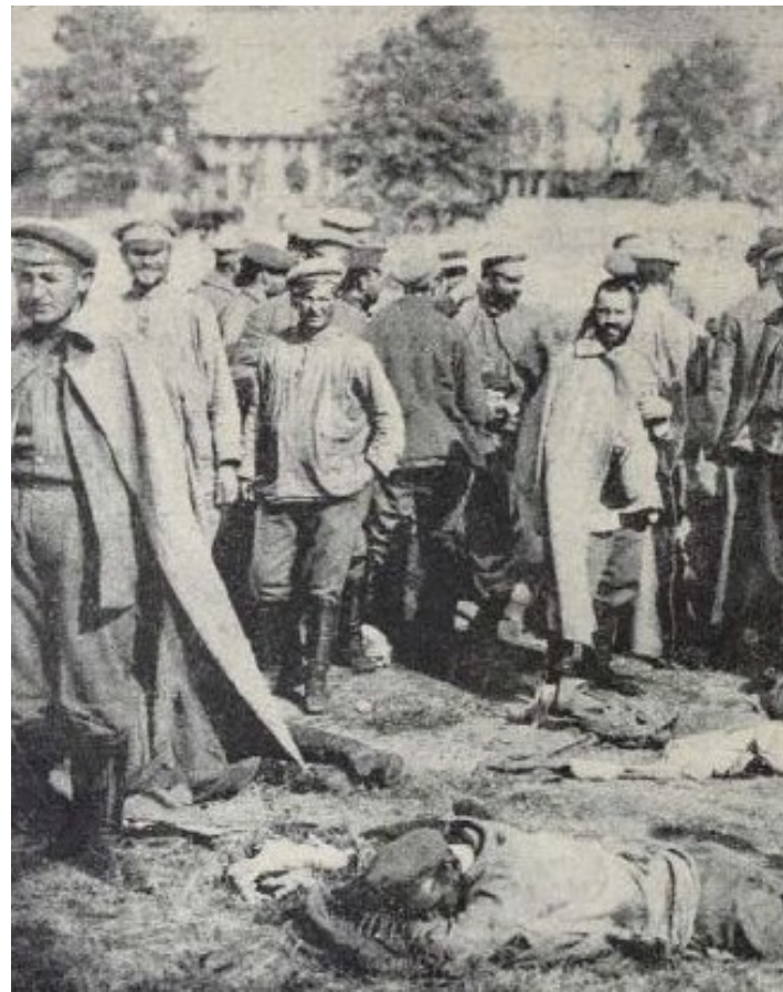
Orosz hadifoglyok Kenyérmezőn. Tolnai Világlapja XIV. évf. 38. sz. (1914. szeptember 20.) 6. o.