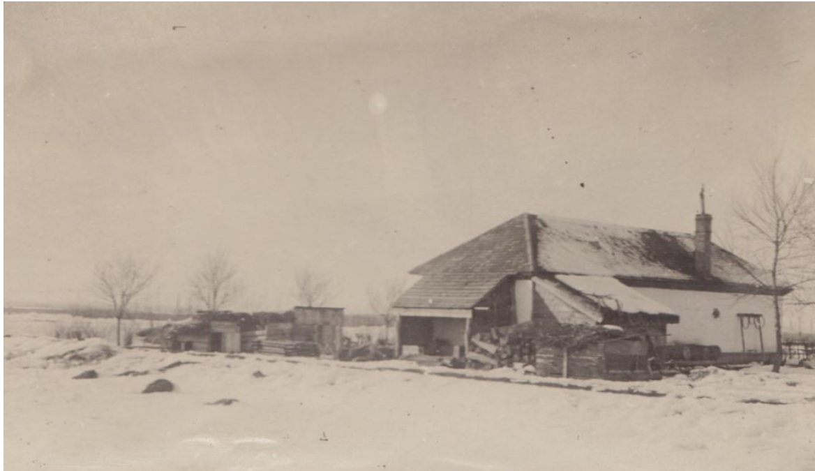
Kovácsműhely a hadifogolytáborban (Viola Bence magángyűjteménye)

A hadifogoly tisztek természetesen jobb elbánásban részesültek. Helyzetükre vonatkozóan ismét A világháború képes krónikája beszámolóját idézzük: „A tisztek elkülönített barakkokban laktak. Egy-egy szobában két-három tiszt. Ágyneműt, ágyat, kellő bútort kaptak. [...] Olvasnak, labdáznak, sakkoznak egymás közt, gyakran elsétálnak őrizettel Esztergomba. Tiszti kosztot kapnak a tiszti kaszinóban, hol szolgálk inaskodnak mellettük.” 30 Amint a cikk is beszámolt róla, a tisztek a kezdeti időszakban akár a városba is kimehettek egy-egy népfelkelő altiszt kíséretében. Később azonban a szökési kísérletek következtében szigorították helyzetükön.