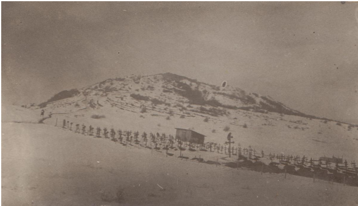
Hadifogoly-temető Kenyérmezőn (valószínűleg a VII. számú)

A nyilvántartások alapján az itt raboskodók közül 4378 fő hunyt el, akiket 7 kenyérmezői és 4 tokodi illetve ebszönybányai temetőben helyeztek örök nyugalomra. Az esztergomi hadikórházakban elhunyt hadifoglyokat a szentgyörgymezői haditemetőben, vagy pedig a város polgári temetőiben (Belvárosi temető, Izraelita temető, Szt. Anna temető) temették el.