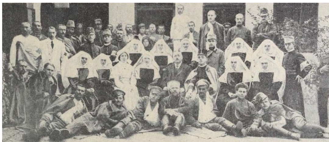
Sebesültek egy csoportja az esztergomi Szent Anna-zárdában berendezett hadikórházban, ahol orosz sebesülteket is ápoltak (Tolnai Világlapja XIV. évf. 44. sz. 1914. november 1. 17. o.)