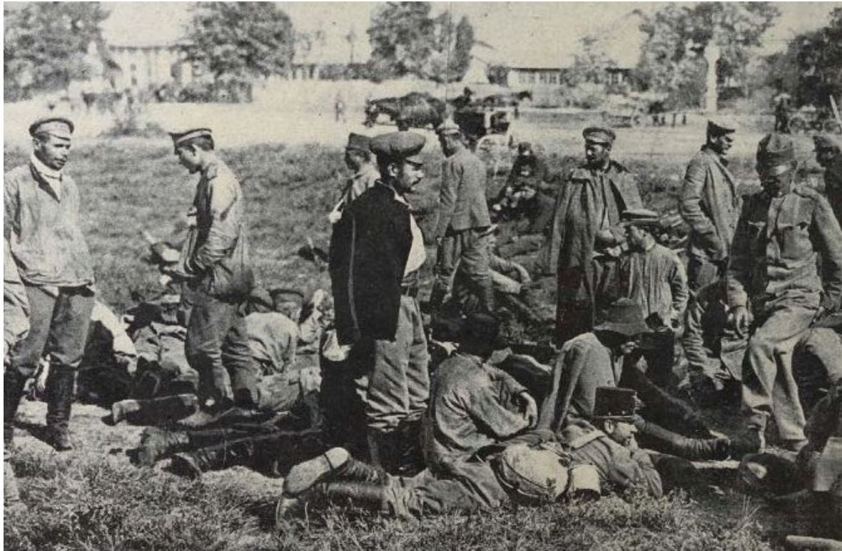
Orosz hadifoglyok Kenyérmezőn (Tolnai Világlapja XIV. évf. 38. sz. 1914. szeptember 20. 6. o.)

Később az Őrhegy másik oldalán, a rózsavölgyi domb hajlásába kerültek az újonnan érkezettek. A szerb frontról érkezők egy részét két nagy cirkuszi sátorban, másik részét pedig a halastóba vezető tápcsatorna mentén helyezték el. A szerb hadifoglyok között azonban hamarosan kolera-járvány tört ki, amely a patakon keresztül az orosz foglyokra is áttért. A vármegye és a város hatóságai a hadvezetőséghez és a belügyi kormányzathoz fordultak segítségért. 1914. szeptember 10-én Sándor János belügyminiszter meglátogatta a tábort, hogy személyesen tanulmányozza a kialakult helyzetet. 3 Szeptember végéig mintegy 220 koleraesetet regisztráltak, közülük naponta 3-4 fő hunyt el. A belügyminiszter rendeletére az alispán intézkedett arról, hogy a betegeket Tokodra, azokat pedig, akik velük érintkeztek, az ebszónyi üres bányatelepre szállítsák át. 4 A járvány továbbterjedésének megakadályozására 1914. szeptember 30-án a vármegye főszolgabírója rendeletet adott ki, amelyben többek között megtiltotta a kenyérmezői és a tokodi fogolytáborok látogatását. Külön felhívta a lakosság figyelmét bizonyos higiéniai szabályok betartására, így az ivóvíz forralására, az étkezés előtti kézmosásra stb. Ha valaki hányásos és hasmenéses tünetekkel betegedett meg, azonnal orvost kellett hívni, abban az esetben pedig, ha valaki hasonló körülmények között hunyt el, azonnal jelenteni kellett az illetékes községhez. 5