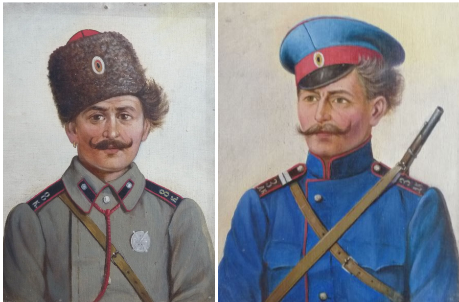
Orosz fogolyportrék a táborból

A hadifogoly tisztek természetesen jobb elbánásban részesültek. Helyzetükre vonatkozóan ismét A világháború képes krónikája beszámolóját idézzük: „A tisztek elkülönített barakkokban laktak. Egy-egy szobában két-három tiszt. Ágyneműt, ágyat, kellő bútort kaptak. [...] Olvasnak, labdáznak, sakkoznak egymás közt, gyakran elsétálnak őrizettel Esztergomba. Tiszti kosztot kapnak a tiszti kaszinóban, hol szolgálk inaskodnak mellettük.” 30 Amint a cikk is beszámolt róla, a tisztek a kezdeti időszakban akár a városba is kimehettek egy-egy népfelkelő altiszt kíséretében. Később azonban a szökési kísérletek következtében szigorították helyzetükön.