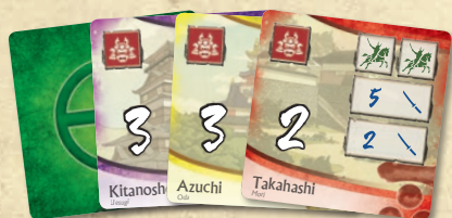
14 vár kártya