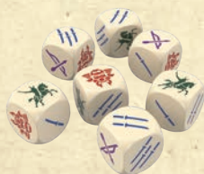
7 speciális dobókocka