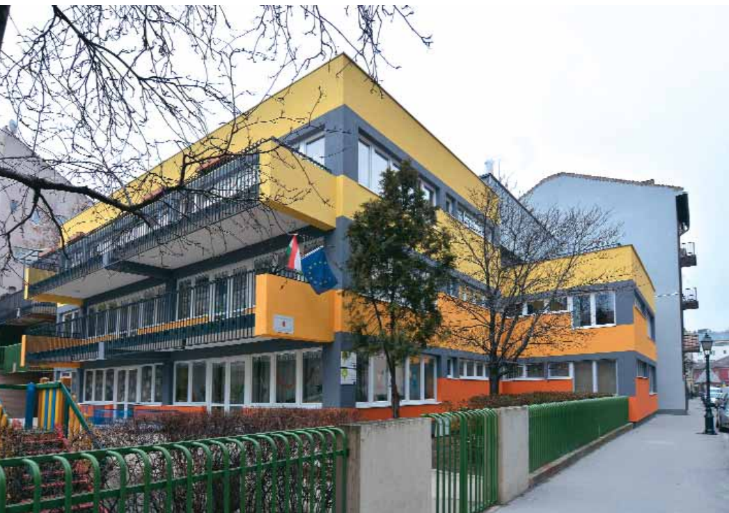
Korszerű hőszigetelés az Iskola utcai bölcsőde épületén

Több mint 170 millió forintos pályázatot nyert az Önkormányzat a kerületi intézmények további energetikai korszerűsítésére. A munkálatokat nyáron kezdték meg az Iskola utca bölcsődében, a Nyárs utcai óvodában, a Mészáros utcai óvodában és a Lovas úti óvodában, illetve bölcsődében. Valamennyi intézmény esetében elvégezték a homlokzatok és a fűdém szerkezetek utólagos hőszigetelését, a nyílászárók cseréjét, a kazánokat modern, kondenzációs berendezésekre cserélték, valamint a radiátorokat termosztatikus szelepekkel szerelték fel.