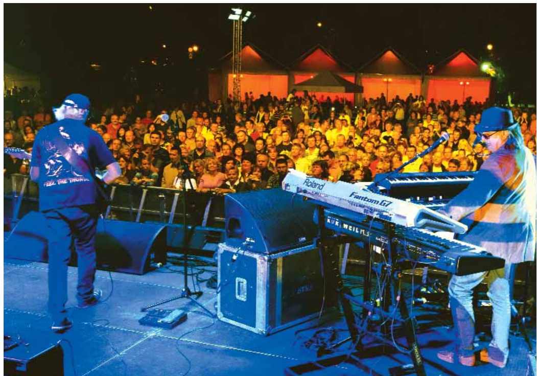
Balázs Fecó, Budavár Díszpolgára búcsúztatta a nyarat

pedig teljes pompájában fogadta a látogatókat. A Várkert Bazár kikötőben is ezen a napon indult meg a BKK kishajóforgalma. A Lánchíd utcában utcabál zajlott, családi programokkal, gasztronómiai bemutatóval és koncertekkel. Augusztus utolsó hétvégéjén mintegy hatvanezren keresték fel a Várkert Bazárt és a királyi kertet.