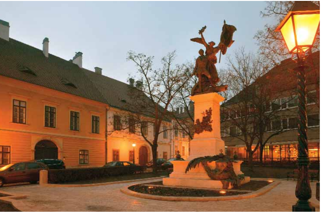
Díszkivilágítást kapott a Honvéd Emlékmű

Az aradi vértanúk emléknapjára készült el a Honvéd Emlékmű díszkivilágítása a felújított Dísz téren. A munkálatok során kijavították a szobor körüli burkolatot.