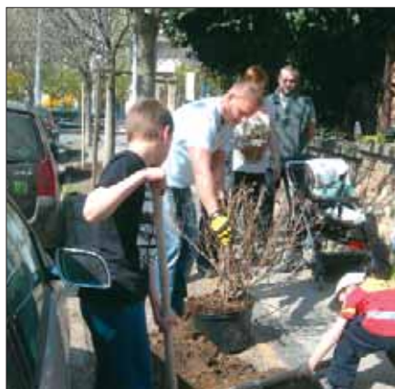
Faültetés a Naphegyen

szeti beavatkozás”, hiszen a teljes rendezés előfeltétele, hogy az itt várakozó buszok számát erőteljesen csökkentsék. Erre azonban csak a budai fonódó villamos megépítése után nyílik lehetőség.