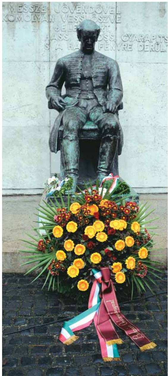
Kölcsey Ferenc szobra a Batthyány téren

Az enyhe télnek köszönhetően már februárban megkezdődhettek a kerületben a felújítási és karbantartási munkálatok. Többek között elvégezték az Esztergomi rondella burkolatának felújítását és a terület részleges parkosítását. Folytatódott a vári útfelújítási program is a Dísz téren.