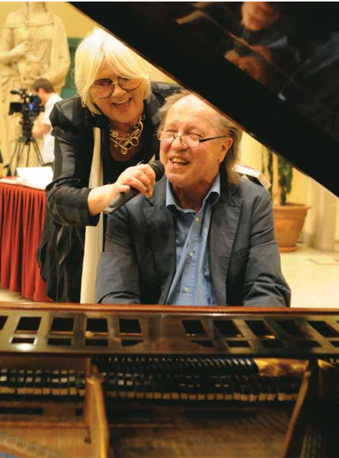
Rögtönzött koncert a Városházán

Május 25-én tartották az európai parlamenti választásokat. A listát állító pártok közül a Fidesz-KDNP 12, a Jobbik 3, az MSZP és a DK 2-2, az LMP és az Együtt-PM 1-1 képviselőt küldhettek ki Brüsszelbe.