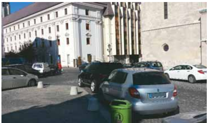
A hajdani kaotikus állapotok a Szentháromság téren

saját forrásból finanszírozta. Az útpályát a Tárnok utcához hasonlóan egy szintbe hozták a járdával, az így kapott sétalórészt pedig vágott felületű bazalt nagykockakővel burkolták. A Szentháromság-szobor körüli és a Magyarság Háza előtti téren díszburkolatot építettek. A Mátyás-templom és környéke burkolatfelújítására az állam 700 millió forintot biztosított.