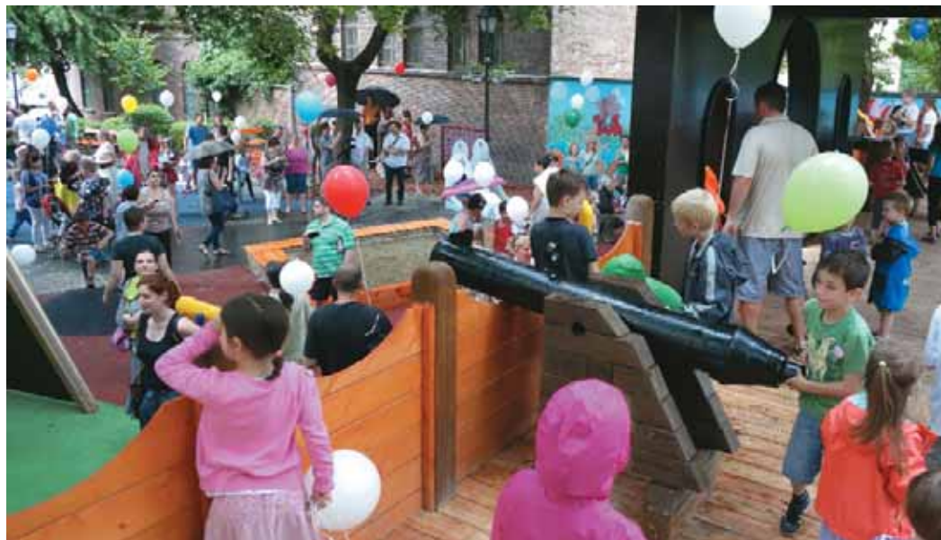
Gyereknapra készült el a kibővített Rumini-játszótér

rendőrök túlórájának finanszírozásához. A rendőrség munkáját a Közbiztonsági Közalapítvány is támogatta, májusban közel egymillió forint értékben adományoztak számítástechnikai eszközöket az I. kerületi rendőrkapitányság részére.