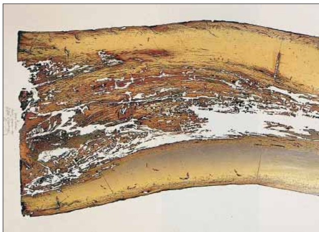
A lendvai művész jellegzetes egyedi fametszete