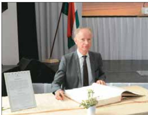
Bertrand du Vignaud, a World Monuments Fund alelnöke

Az avatáson az Önkormányzat meghívására részt vett Bertrand du Vignaud, a World Monuments Fund alelnöke is. A New York-i székhelyű nemzetközi műemlékvédő szervezet európai vezetője a Várkert Bazár „mentőinek” tiszteletére adott fogadáson jelentette be, hogy a Várkert lekerült a világ száz legveszélyeztetettebb műemlékeinek listájáról. E nem túl dicsőséges „kitüntetés” még 1997 nyerte el az épület, a Budavári Önkormányzat ezzel próbálta felhívni a figyelmet a páratlan építészeti remekmű elhanyagolt sorsára. A megnyitó utáni hétvégén idegenvezetők segítettek a látogatókat, a 3 nap alatt 50 ezren keresték fel a Várkert Bazárt és a Déli Paloták kiállításait.