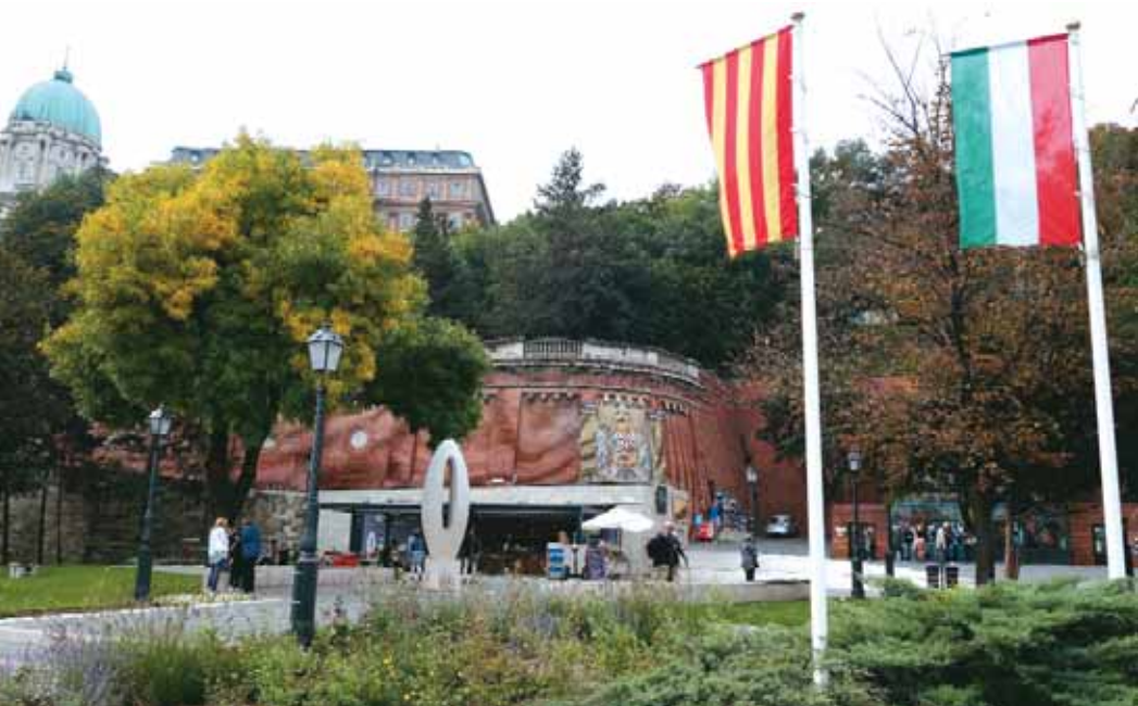
Önkormányzati beruházásban született újjá a Clark Ádám tér