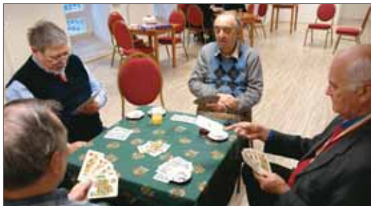
Bridzs-parti a Vízivárosi Klubban

Március 24-én szabadtéri koncerttel és kiállítással nyitotta meg kapuit a Batthyány utca 26. szám alatt a kerület legújabb találkozóhelye. A Vízivárosi Klub célja, hogy helyszínt kínáljon az itt élőknek, közösségeknek, civil szerveze-