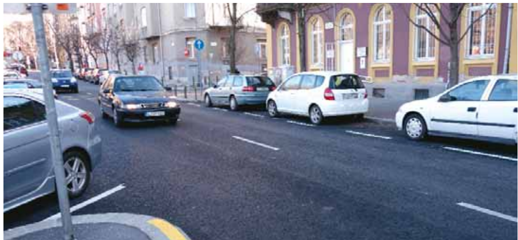
A kerékpárosok biztonságára is figyeltek a Pauler utcai csomópont átépítésekor

Ősszel befejeződött a Mikó utca alsó szakaszának felújítása. Az Attila út–Krisztina körút közötti részt újraaszfaltozták, a megsüllyedt szegélyeket kicserélték. A ferde, 45 fokos parkolóhelyek átkerültek a Vérmező oldalára, így a Pauler utcai csomópont beláthatóbb, biztonságosabb lett. A biztonságot szolgálja az is, hogy a BKK kerékpárútvonal-tervéhez igazodva átépítették járda-szigeteket is. Ugyancsak ősszel készült el a Mátray utca felújítása. A munkálatok során kicserélték az útpálya aszfaltburkolatát, valamint egyes helyeken a járdaburkolatot is.