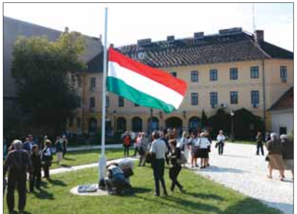
Félárbócra engedett magyar zászló a Táncsics-börtön udvarán

Október 5-én és 6-án, az aradi vértanúk emléknapja alkalmából az Önkormányzat kezdeményezésére megnyitotta kapuit a Táncsics-börtön, amelyet augusztusban kapott vissza a magyar állam. Az ingatlan 1948-ban háborús jóvátételként került az Egyesült Államok tulajdonába. Visszaadásáról George W. Bush amerikai elnök 2006-os budapesti látogatásán született elvi egyezség, az erről szóló nemzetközi szerződést 2007-ben egy-