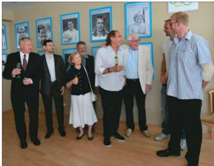
Olimpiai bajnokok a Czákón

Június 13-án számos, az I. kerülethez kötődő magyar olimpiai bajnok, illetve a már elhunyt olimpiikon sportolók családtagjai látogattak el a Czákó utcai Sport- és Szabadidőközpontban