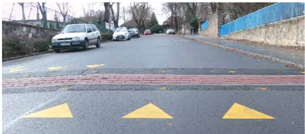
Biztonságosabb lett a Czakó utca

Augusztusban felújították a Czakó utcát a Naphegy utca–Dezsó utcai szakaszon. A munkálatok során a töredezett aszfaltot lemarták és újraaszfaltoztak, kijavították a szegélyköveket és a vízelnyelőket. A közeli Lisznyai-iskola diákjai és a sportpályára látogatók biztonsága érdekében fekvőrendőröket is építettek az útszakaszra. Ismert, hogy 2013-ban, az első ütemben már elkészült a Naphegy utcai járdaépítés: az addigi, földdel fedett gyalogjáró térburkolatot kapott, és a Kereszt és a Czakó utca közötti szakaszon újraaszfaltozták az útpályát.