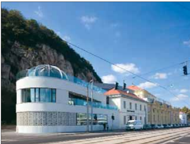
Az egykori palackozóüzem helyén wellnessfürdő épült

Teljesen megújult a Rudas fürdő, amely wellness-részleggel is gyarapodott. A korábbi években a műemléki tereket korszerűen felújították, rendbe tették a külső homlokzatot, és az utolsó ütemben a régóta üresen álló egykori palackozóüzem területén egy új élményfürdő-részleg építése történt meg. A Budapest Gyógyfürdői és Hévízei Zrt. mintegy egymilliárd forintos beruházásában elkészült modern szárnyat Tarlós István főpolgármester avatta fel.