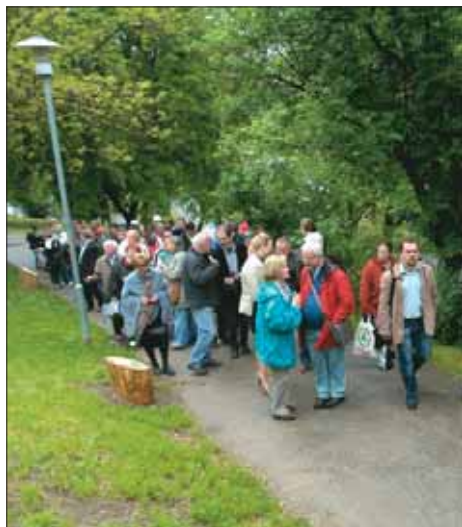
Közös séta a Tabáni Tanösvényen

Április 22-én, a Föld Napján avatták fel az Önkormányzat által kibővített és felújított Tabáni Tanösvényt. Az Orvos lépcsőtől induló, száz állomást, valamint madár- és denevérodúkat magában foglaló, közel egy kilométeres sétaúton a látogatók számos különleges, a Kárpát-medencében őshonos növényt ismerhetnek meg, köztük a XVII. században ültetett híres tabáni eperfát is. Dr. Lányi András író-filozófus arra hívta fel a figyelmet, hogy egy szelíd, kevésbé látványos, de annál fontosabb beruházásról van szó, amely hozzájárulhat ahhoz, hogy az errefejárók rácsodálkozzanak a velünk élő természetre, és kedvet kapjanak a kirándulásra. A megnyitó után tavasszal több sétát is tartott az Önkormányzat a Tanösvényen.