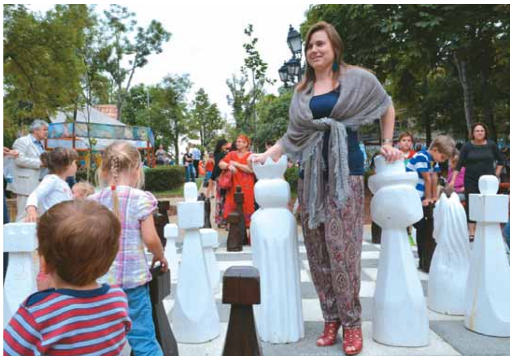
Polgár Judit sakkvilágbajnokkal is játszhattak a gyerekek a Vuk játszótéren