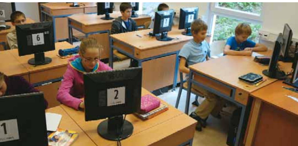
Új informatika terem a Lisznyai utcai iskolában

Bár az iskolák már állami fenntartásba kerültek és a tankerületekhez tartoznak, a Budavári Önkormányzat igyekszik minden segítséget megadni a kerületi intézményeknek a korszerű