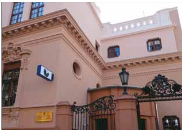
A Maros utcai szakrendelő bejárata

Szeptember 29-én a kívülről is felújított Maros utcai szakorvosi rendelőintézetet adta át az Önkormányzat. A 90-es évek második felében, amikor a kerület átvette a Szent János Kórháztól a bezárásra ítélt rendelőt, rendkívül elszomorító állapotok uralkodtak. A folyamatos felújítások eredményeként fokozatosan szépült az épület. Liftet alakítottak ki, korszerűsítették a fűtési rendszert, kicserélték a nyílászárókat, és új kezelőket, például gyógytor-