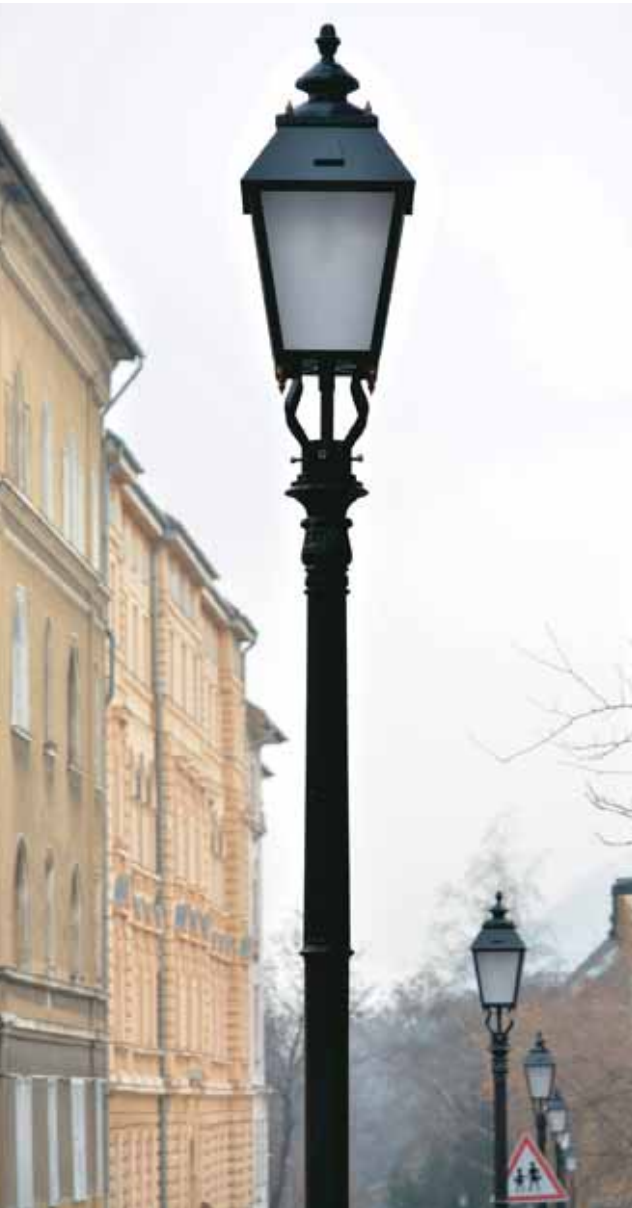
Hamisítatlan krisztinavárosi hangulat

mennyi irányban akadálymentes kapcsolatok jönnek létre, a Várfok utcai buszmegállókat mozgólépcsőn és liften is el lehet majd érni.