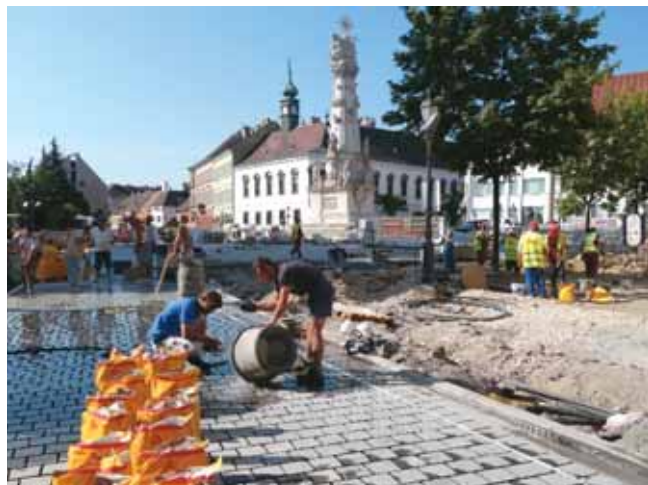
Készül az új burkolat a Szentháromság téren

Elkészült a Hess András tér és a Szentháromság utca burkolatának felújítása is, amit az Önkormányzat saját beruházásban végzett el. A munkálatok a Szentháromság téren és a Mátyás-templom körüli területen folytatódtak. Megújult a Kard utca és a Hajadon utca is. A Főváros által végzett városi útfelújítás is a végéhez ért: az utolsó szakaszban a Fortuna utca készült el.