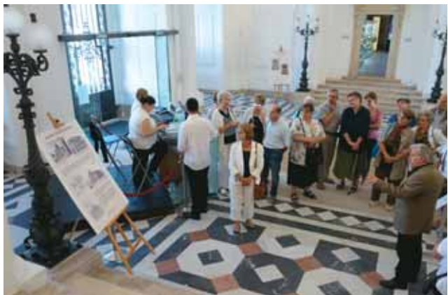
Látogatók a 70 éve elzárt Dísz tér 17-ben

Főparancsnokság egykori épületének torzóját. A felújításról végül az Orbán-kormány döntött 2012-ben. Az épületben kiállítótermetek alakítottak ki, nyitáskor Zsolnay-kiállítás várta a látogatókat. Az Önkormányzat az I. kerületi lakosok számára ingyenes látogatásokat és tárlatvezetéseket szervezett, hogy bemutassa a 70 éve elzárt épületet.