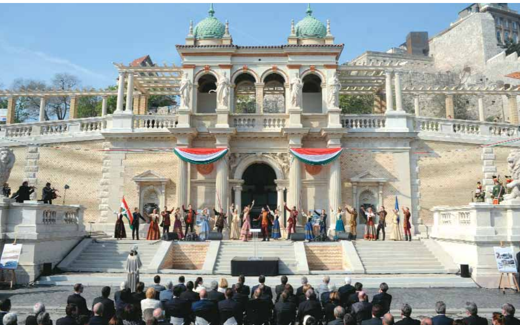
Ünnepi műsor a Várkert Bazár átadásán

ségnek. Avatóbeszédében a miniszterelnök úgy fogalmazott, hogy a rekonstrukcióval a magyar műemlékvédelem történetéből egy harminc éve éktelenkedő szegényfoltot sikerült eltüntetni. A Várkert Bazár sorsa azt mutatja, hogy ha van egységes cél és egységes akarat, akkor a magyarok lenyűgöző dolgokat tudnak létrehozni.