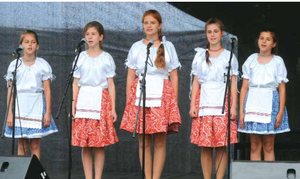
A munkácsi magyar iskola növendékeinek műsora a Magyar Nyelv és a Magyar Könyv Ünnepe