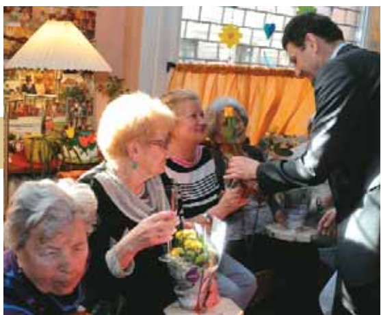
Kerületi hölgyek köszöntése

Nőnap alkalmából a kerület vezetése az idősklubokban pezsgővel és virággal köszöntötte a hölgyeket. A polgármester az eseményen köszöntőn úgy fogalmazott: nem elég egyetlen ünnepnapon megemlékezni a hölgyekről, hiszen megérdemelnék, hogy minden nap köszöntsék őket.