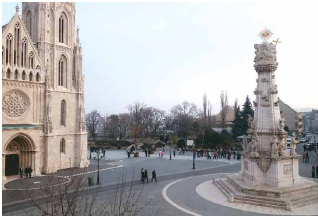
A Kormány, a Főváros és a kerület közös erőfeszítésével 2014 végére megújultak a vári utak

saját forrásból finanszírozta. Az útpályát a Tárnok utcához hasonlóan egy szintbe hozták a járdával, az így kapott sétalórészt pedig vágott felületű bazalt nagykockakővel burkolták. A Szentháromság-szobor körüli és a Magyarság Háza előtti téren díszburkolatot építettek. A Mátyás-templom és környéke burkolatfelújítására az állam 700 millió forintot biztosított.