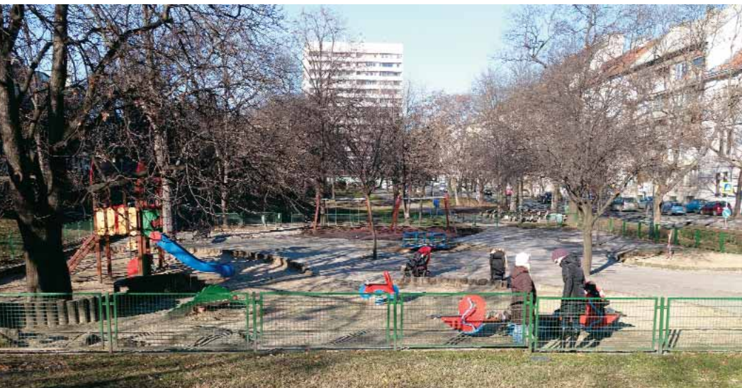
Rendezett játszótér a Horváth-kertben

A 2014-es évben számos fejlesztés történt a kerületi játszótereken. Elsőként a Horváth-kerti játszótér kerítették körbe, hogy az Attila út és a Krisztina körút által határolt parkot rendezettebbé és tisztán tarthatóvá tegyék.