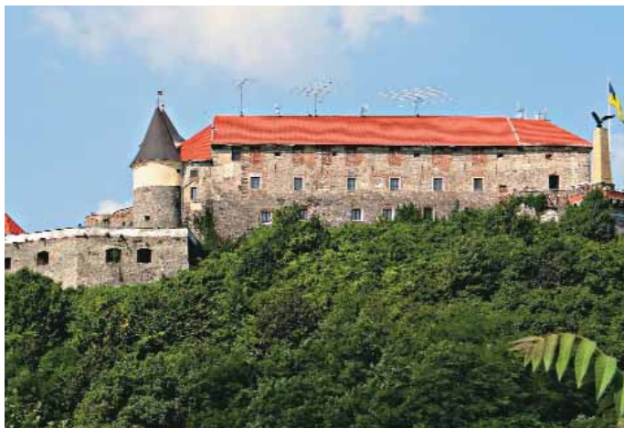
Munkács vára Kárpátalján