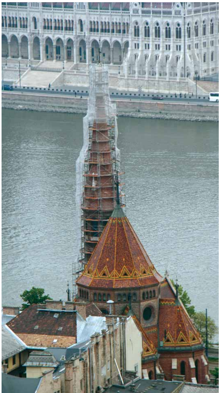
Kormányzati forrásból újították fel a Szilágyi Dezső téri templomot

Szeptember 13-án a Budai Református Egyházközség hálaadó ünnepséget rendezett abból az alkalomból, hogy befejeződött a Szilágyi Dezső téri templom felújítása, amelyre a Kormány biztosított forrást. A Nemzeti Örökség Intézete történelmi emlékhellyé nyilvánította a műemléképületet, valamint egy sztét is felavattak a főbejárat mellett. Az avatáson a kerület nevében Nagy Gábor Tamás polgármester szólalt fel, az ezt követő hálaadó istentiszteleten Balog Zoltán miniszter és Szabó István püspök is beszédet mondott. A templom környezetének rendbetételét a gyülekezet tagjai vállalták magukra.