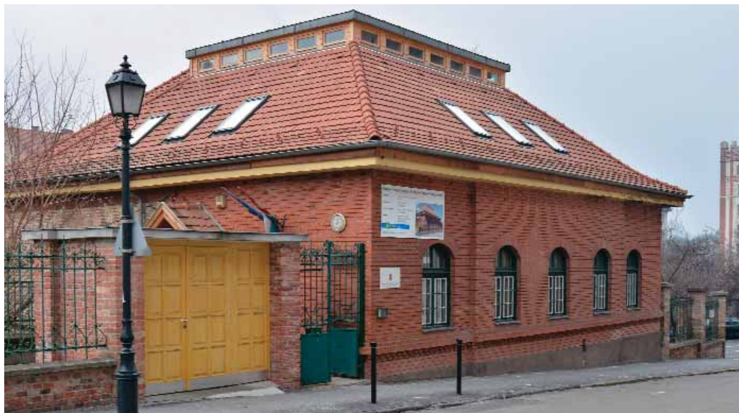
Kibővítették a Pedagógiai Szakszolgálat épületét

Szeptember 8-án adta át az Önkormányzat vezetése az I. kerületi Pedagógiai Szakszolgálat (korábban Nevelési Tanácsadó) felújított épületét a Logodi utcában. A korszerűsítés során a tetőtérben 6 új helyiséget alakítottak ki, egyebek mellett tanácsadó, terápiás és csoportfoglalkozásra alkalmas szobákat.