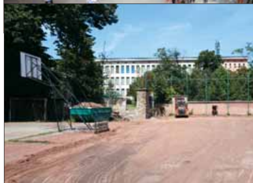
Új sportpálya a Szilágyi Erzsébet Gimnáziumban

Évről évre a nyári szünetben kerül sor a kerületi oktatási, szociális és művelődési intézmények felújítására, a szükséges karbantartási munkálatok elvégzésére. 2014-ben az Önkormányzat 170 millió forintot biztosított arra, hogy a gyermekek kényelmes, tiszta és jól felszerelt intézményekben játszhassanak és tanulhassanak.