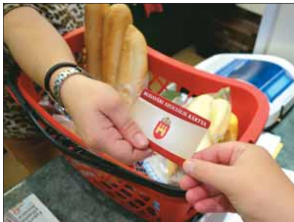
Emelkedett a szociális juttatások összege

forrást jelentett az intézményi felújításokra és a tematikus játszótér-építési program folytatására is. Emellett az Önkormányzat csatlakozott a Kormány rezsiszökkentési programjához. 2014-ben nem emelték a lakbérek, a bérlakásban élő, mellékvízmérővel nem rendelkező lakók esetében pedig márciustól 15 százalékkal csökkentették a víz- és csatornadíj átalányát. A Budavári Önkormányzat döntésével annak a lakossági elvárásnak a megvalósulását segítette, hogy a rezsiterhek az európai átlagnak megfelelő árszínvonalra csökkenjenek.