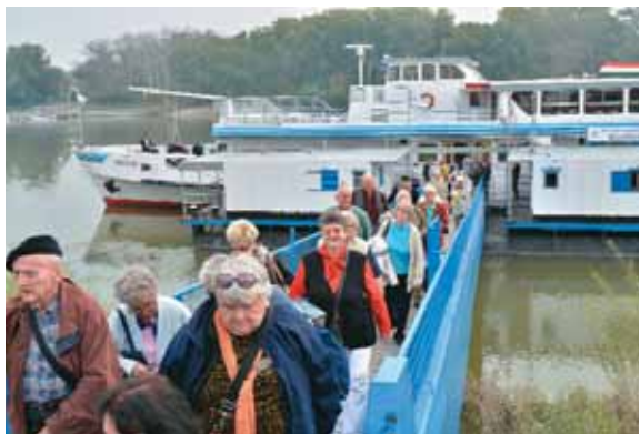
Töretlen népszerűségnek örvend a hajókirándulás

Október 1-jén, az Idősek Világnapján ismét hajókirándulásra hívta a kerületi nyugdíjasokat a Budavári Önkormányzat. Az úti cél a festői szépségű Szentendre volt, ahol képzett idegenvezetők kísérték az időseket, a hajóra visszatérve pedig finom ebéd várta a résztvevőket.