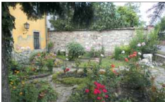
Népszerű a kertszépítési akció

A képviselők az ülésen döntöttek a kerületi kertszépítési akcióról is. A Szépítsük meg közösen a lakóházak udvarait címmel hirdetett program célja, hogy a lakók – az Önkormányzat segítségével – közös munkával tegyenek környezetükért. Az akcióra több mint száz társasház jelentkezett, a felmérések után a kertszépítési munkák az őszi és a tavaszi időszakban zajlanak.