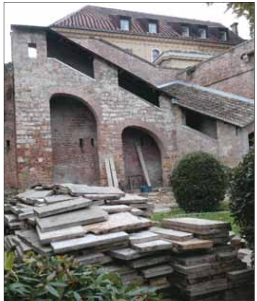
Úniós forrásból épül a felvonó az Iskola lépcsőnél

Október második felében a Budai Vár és környéke közlekedésfejlesztés című projekt újabb szakaszaként megkezdődött az Öntőház utca felújítása. A munkálatok során a meglévő burkolatot elbontják, és új, nagy-kockakő burkolatot építenek, gránit kockakő szegéllyel. Felújítják a parkolót és a közvilágítást, valamint rendezik a zöldterületet is. Megkezdődött a vári liftek építése is. A Gránit lépcsőhöz tervezett lift a Tóth Árpád sétányra, a Szentháromság utcához hozza majd az utasokat, a Murad pasa bástyájánál tervezett lift a Lovas úti parkolótól az Anjou sétányra szállít, az Iskola lépcsőhöz tervezett lift pedig az Ibolya utcához, a Hess András térhez. A felvonók a Budai Vár akadálymentes megközelítését segítik majd elő.