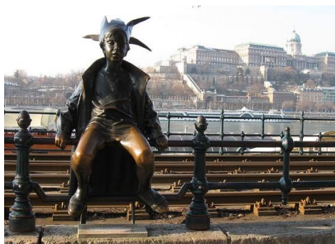
A Kiskirálylány szobra a budapesti Duna-parton by Misibacsi. Forrás: Wikipedia