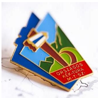
A jelvény

Források: Kéktúra , Turista Magazin , Gerecse50 , Kinizsi , Mbtrail , Az Országos Kéktúra útvonalvázlat és igazolófüzet , MTSZ 2009