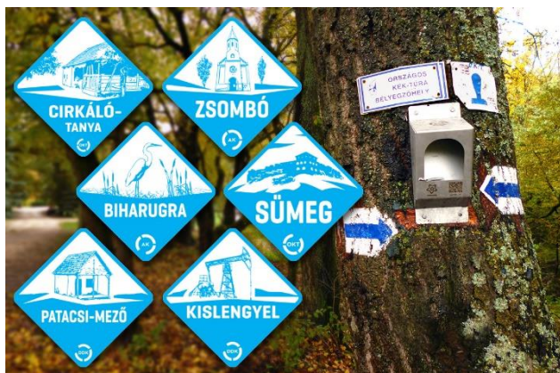
Néhány pecsét

A túrát a szervezők 27 szakaszra osztották, a leghosszabb a 19-es szakasz a Cserhátban, ami kb. 74 km. A legrövidebb a 14-es szakasz, ez 14 km hosszú, közel Budapesthez. A legnehezebb a 23-as számú túra, ahol az út 2085 métert emelkedik . A szakaszokat bármikor, bármennyi idő alatt, bármilyen sorrendben, bármilyen irányban meg lehet tenni, a teljes útvonalhoz összesen körülbelül 350 órára van szükség.