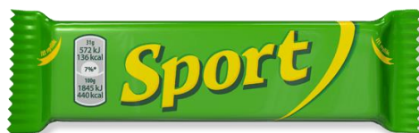
Így néz ki a Sport szelet ma.

A Sport szelet 25 g-os verziója ma is kapható, és a csomagolása is nagyon hasonlít az eredetire - de 2004 óta már nem Budapesten, hanem Szlovákiában, Pozsonyban (Bratislava) gyártják. Az éhesebbek normál, XL és XXL méretet is választhatnak, utóbbi kétszer akkora, mint az eredeti volt. A mostani gyártó a Mondelez Hungária Kft. szerint évente 46 millió darabot adnak el belőle, azaz kb. 1800 tonna Sport csokit eszünk meg egy évben.