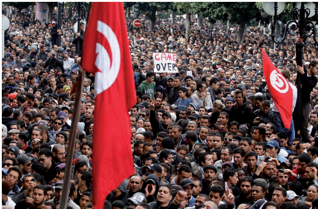
Óriástüntetés Tunisz belvárosában, 2011. január 14-én