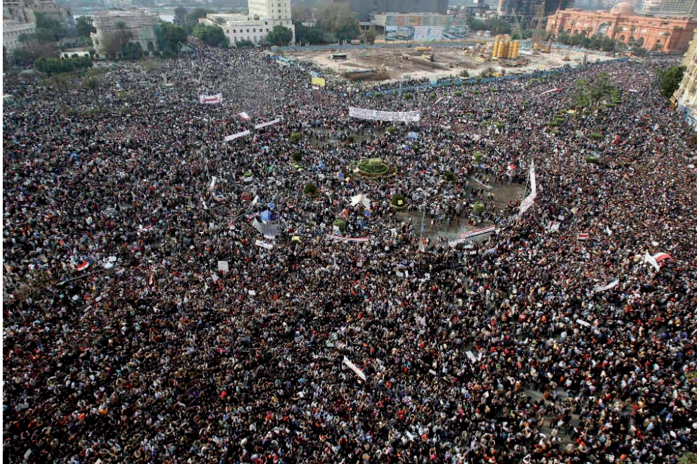
Százezrek a kairói Tahrír-téren

pátia-reakcióját csupán eseti, avagy potenciálisan eszkalálódó jelenségként kell-e értelmezni. Egyiptom körülbelül 80 milliós lakosságának nagy többsége muszlim, az ország, földrajzi fekvése, valamint az arab világban betöltött szerepe miatt az Egyesült Államok kiemelt stratégiai partnere. Az 1953-ban brit uralom alól függetlenedett országot mindvégig katonai diktátorok irányították, Gamal Abdel Nasszer, Anvar Szadat, majd három évtizede Hoszni Mubarak személyében. Noha a Szuezi-csatorna jelentőségének csökkenésével Egyiptom szerepe visszaesett, az arab–izraeli béketárgyalások legfőbb letéteményeseként Kairó továbbra is a térség geopolitikai folyamatainak középpontjában maradt, a romló gazdasági mutatók ellenére. Természetesen a többi arab államhoz hasonlóan, a növekvő népesség, illetve az oktatás színvonalának emelkedése dacára zuhanó életszínvonal a Mubarak-rendszert is rendkívüli kihívások elé állította.