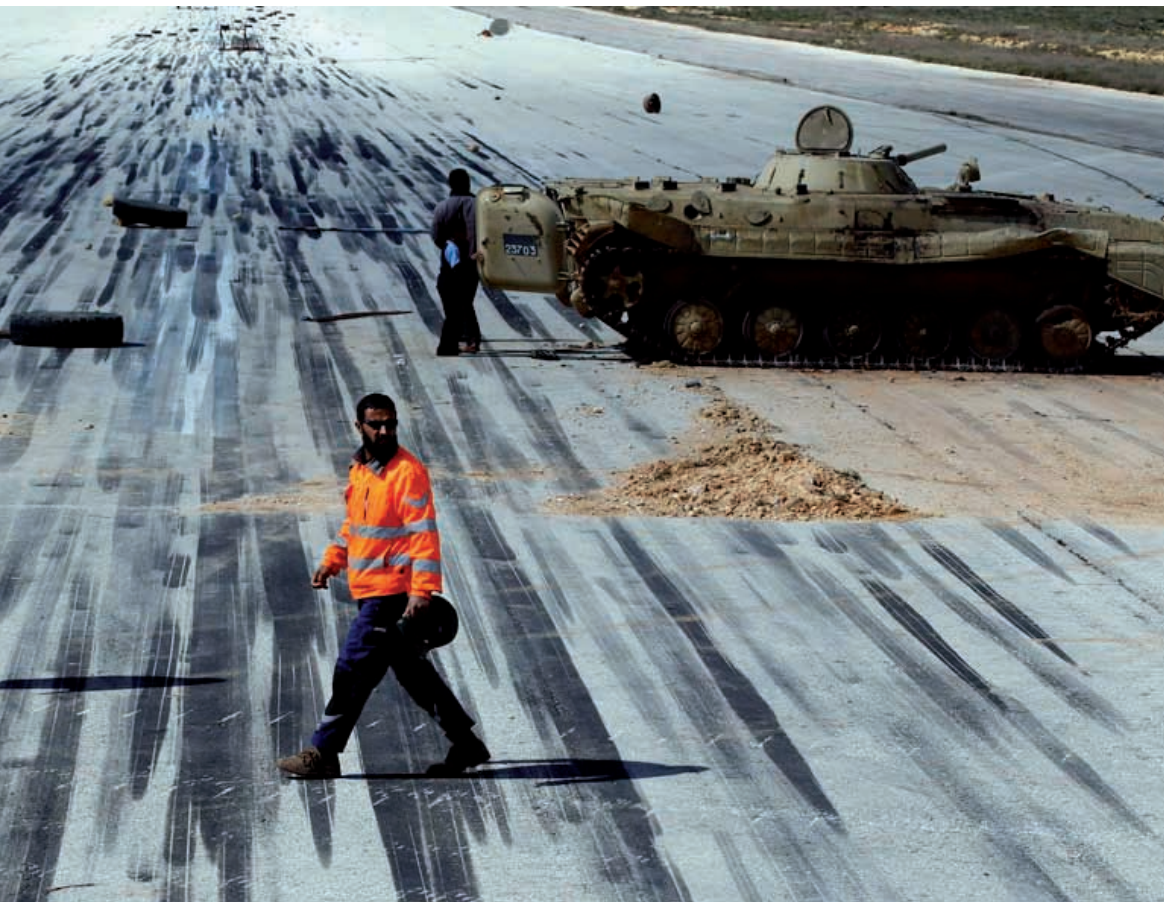
Felkelők által elfoglalt repülőtér a kelet-líbiai Al-Abrak városában