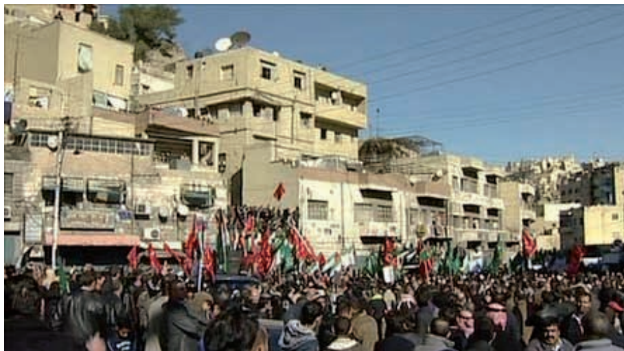
Tüntetés Jordániában, 2011 januárjában