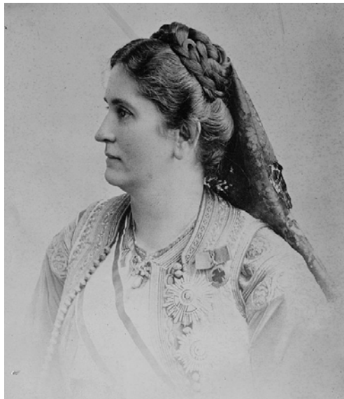
03 – Ilona édesanyja, Milena montenegrói királyné