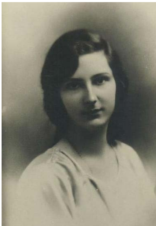
06 – Harmadik lánya, Giovanna III. Borisz bolgár cár felesége lett