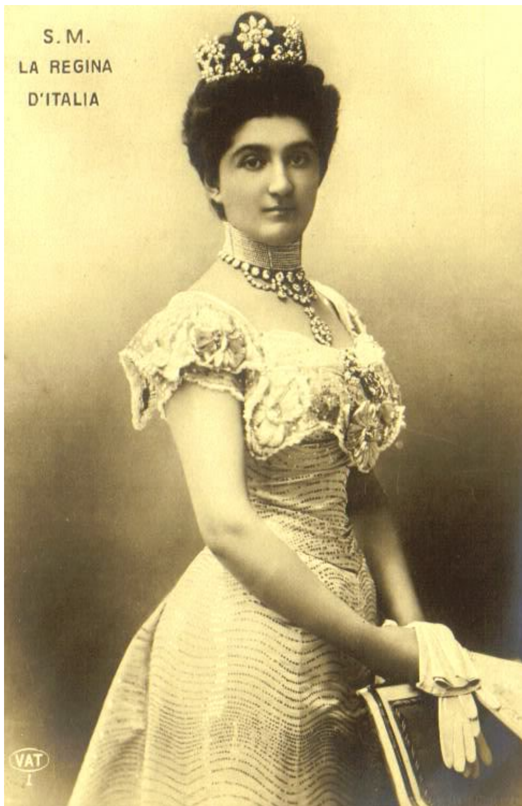
08 – Az ifjú királyné