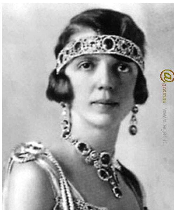
07 – Második lánya, Mafalda hercegnő a buchenwaldi koncentrációs táborban végezte