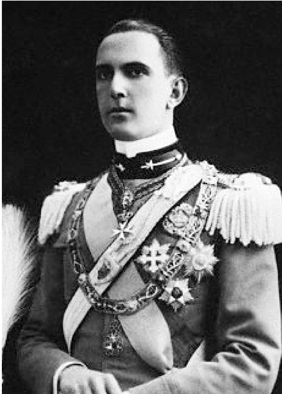
10 – Egyetlen fia, II. Umberto volt Olaszország utolsó királya