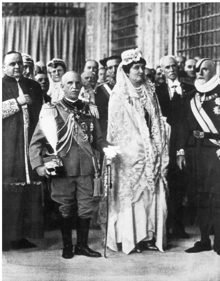
13 - A királyné legalább egy fejjel magasabb volt a férjénél