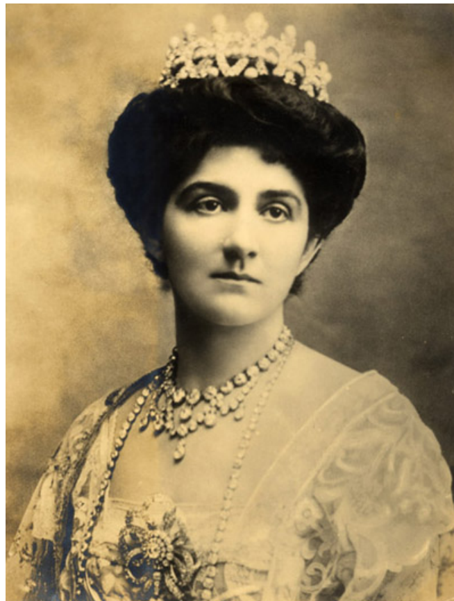
01 – Ileana királyné még túl az ötvenen is igazi klasszikus szépségnek számított

1946. május 9-én III. Viktor Emánuel király, engedve a politikai nyomásnak, egyetlen fia javára lemondott az olasz trónról, majd Pollenzo grófjaként feleségével együtt egyiptomi száműzésbe vonult. Barátjuk Faruk király Alexandriában egy külön palotát bocsátott a rendelkezésükre, ám a volt király egészségét az átélt megannyi megpróbáltatás komolyan kikezdte, így hosszas betegeskedést követően a következő év végén elhalálozott. Ilonánál három évre rá rákos daganatot diagnosztizáltak, így gyógykezelésre a franciaországi Montpellier városába költözött, hogy az ottani Saint Cóm klinikán kezeljék. Itt érte a halál 1952. november 28-án. Végakarátának megfelelően a helyi köztemetőben helyezték örök nyugalomra; temetési szertartásán a híres humanista előtt az egész város lerótta kegyeletét. Azóta mind több helyen állítanak emlékművet számára. Fényképe halálának ötvenedik évfordulóján feltűnt az olasz postabélyegeken is.