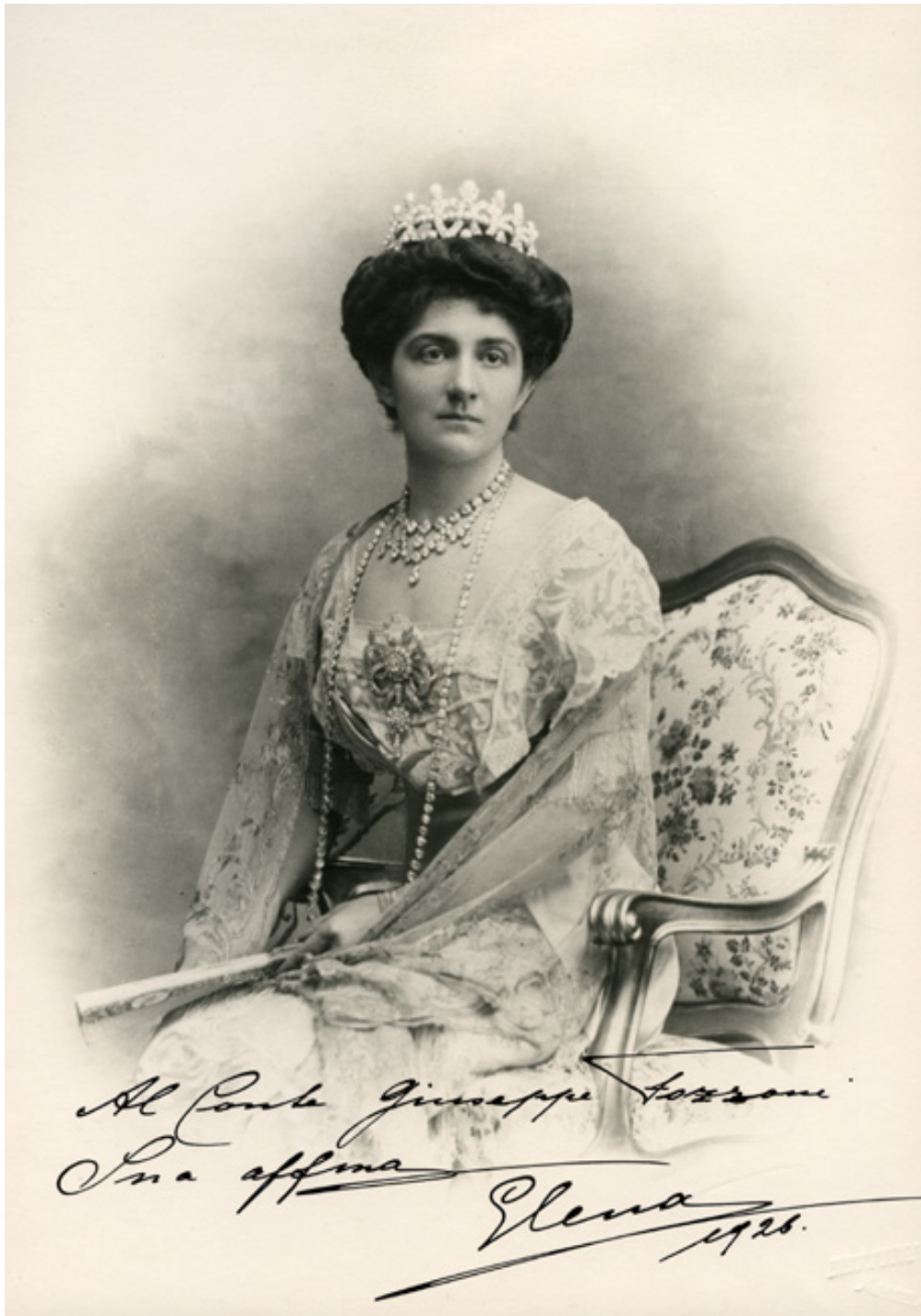
05 – Ilona királyné még túl az ötvenen is igazi klasszikus szépségnek számított