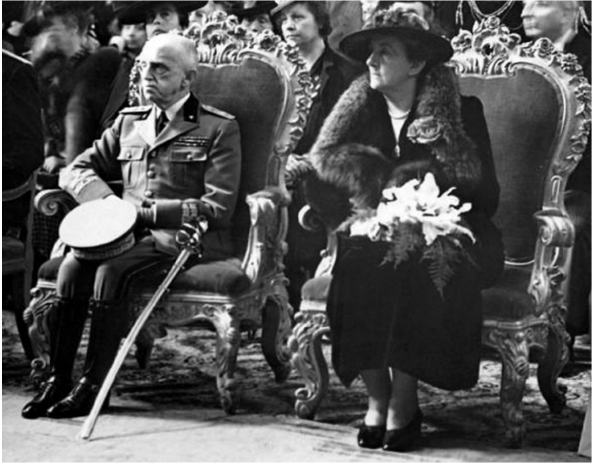
15 - Az idős királyi pár