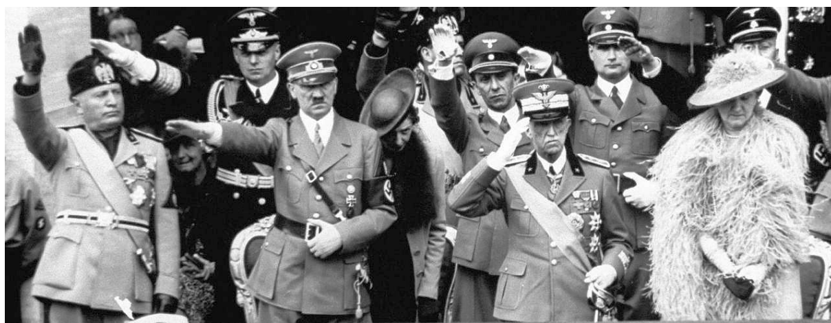
14 - Sem a király, sem a királyné nem volt hajlandó náci karlendítéssel üdvözölni a Rómába látogató Hitlert