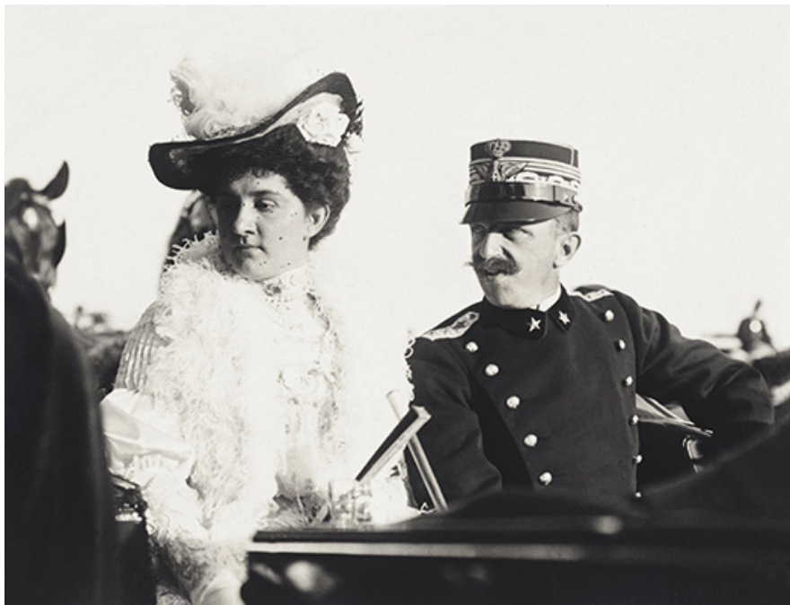
12, 12a – A király gyakran vitte feleségét sétakocsikázásra