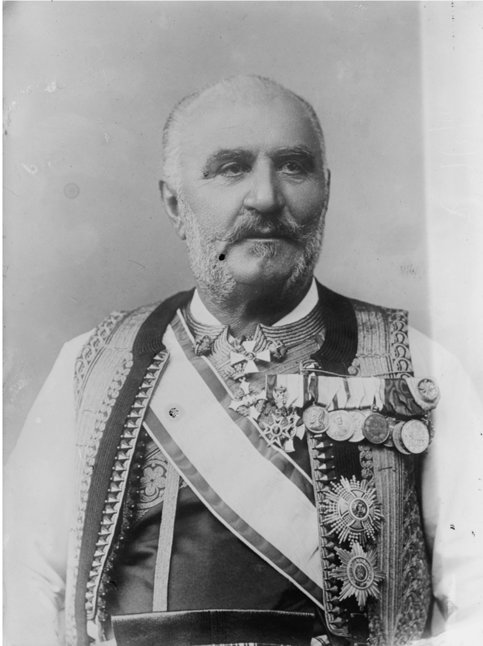
04 – A királyné édesapja, Miklós montenegrói uralkodó