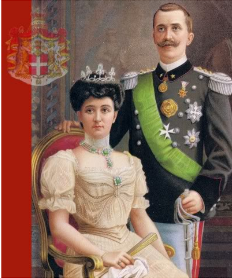
02 – Államérdekként indult, majd igazi szerelem lett belőle: III. Viktor Emánuel olasz király és Ilona királyné