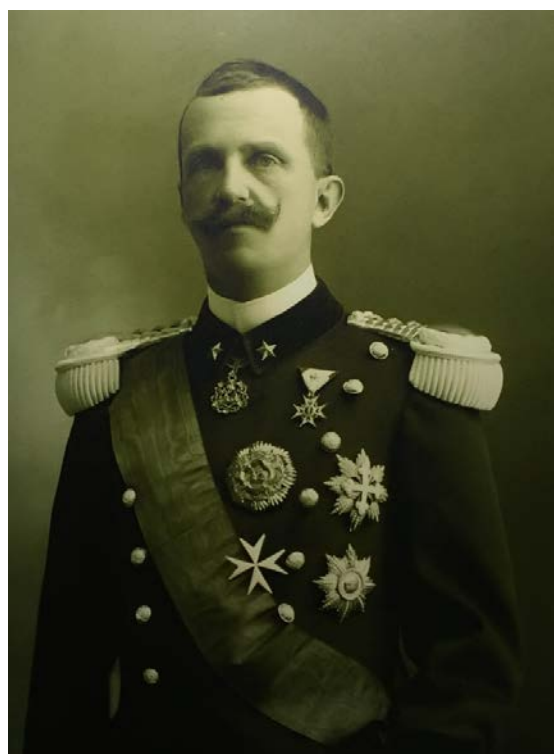
11, 11a – III. Viktor Emánuel olasz király ötven évig élt boldog házasságban feleségével