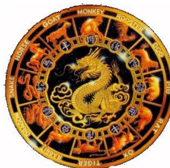
A kínai horoszkóp

A nyugati kultúrákban a közel-keleti asztrológia terjedt el, de a Távol-Keleten, a rendszerükben ugyan hasonló, de mégis lényegesen eltérő kínai asztrológiát veszik alapul.