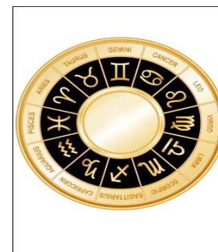
A közel-keleti horoszkóp

Ha néhány évezredet ugunk vissza a történelemben, akkor megtudjuk, hogy már a sumérok is hatalmas asztrológiai tudással rendelkeztek, amit számos fennmaradt írásos emlék és régészeti lelet támaszt alá. A horoszkópok készítése az uralkodóhoz közelálló papok és főméltóságok feladatköréhez tartozott.