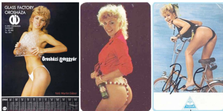
17–19. képek: Bíró Ica-kártyanaptárak.

A szocializmus kori test-tabu a rendszerváltás felé közeledve egyre inkább eltűnni látszott, és a meztelen női test előtérbe kerülése (talán az addigi tabusítás miatt) egyre meghatározóbb lett.