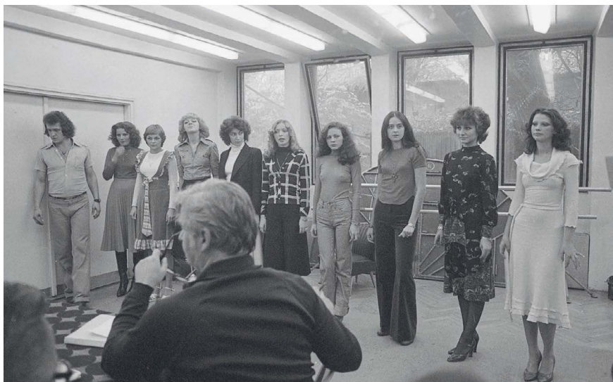
9. kép: Az Artistaképző Intézet manökenfelvételének eredményhirdetése 1979-ben.

A sokszor hetven feletti létszámú jelentkezőből az iskola tanárai, a Magyar Hirdető megbízottja és Nádor Vera divattervező választották ki a továbbjutókat, akik immár felöltözve, legmutatósabb ruhájukban, zavart, de elégedett mosollyal nyugtázták, hogy bejutottak.