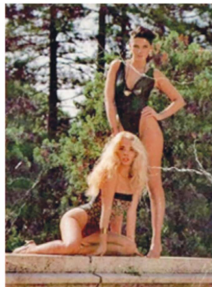
13–16. képek: Reklámfotók és kártyanaptárak az 1980-as évekből.