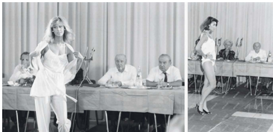
11. és 12. képek: Sütő Enikő és Zuggó Erika 44 manökenek a Habselyem Kötöttárugyár termékeit mutatják be Kádár Jánosnak, a Magyar Szocialista Munkáspárt Központi Bizottsága első titkárának és Havasi Ferencnek az MSZMP Politikai Bizottsága tagjának. 45 46

ményről több napilap, hetilap tudósított, de csak a program hivatalos részéről tudósítottak és tettek közre fotóanyagot.