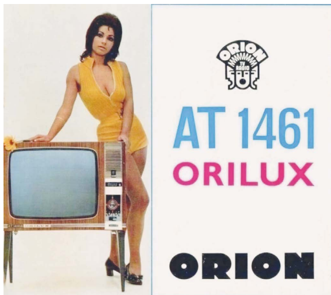
10. kép: Orion tv-reklám, Keravill, 1973.

Komjáthy Ági szülei sem fogadták kitörő lelkesedéssel lányuk induló modellkarrierjét: