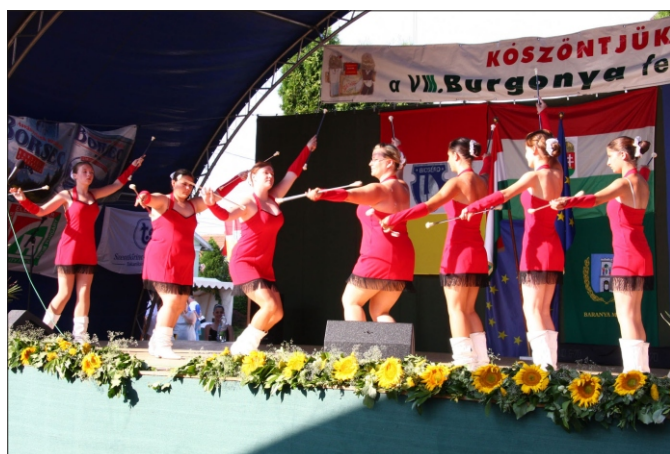
Aki nem lép egyszerre...

A koreográfiát vezetőjük segítségével közösen állítják össze a gyerekek, mindig figyelembe véve az ötletes, látványos megoldásokra tett javaslatokat. A ruhákat, az utazási és egyéb költségeket önkormányzati és szponzori