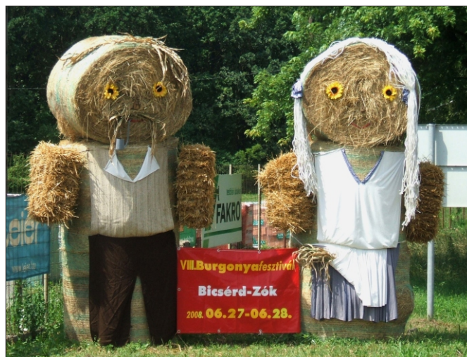
Vendégváró szalmabábuk

A rendezvény sikerét segítette a támogatók részéről megmu-