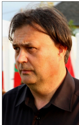
Vér József polgármester

ben nem talál mindenki munkát, ezért többen Pécsen dolgoznak, és gyermekeiket is oda járatják iskolába. Mi itt azon munkálkodunk, hogy megteremtjük a községben a mindennapi élethez szükséges feltételeket, kedvező körülményeket, és ezzel megadjuk a lehetőséget a közösségi életbe való bekapcsolódásra is.