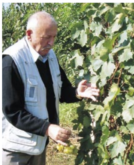
Kertbarát a kertben