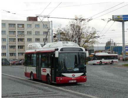
A Siemens-Rampini elektromos midibusza Pardubicében a trolibusz felsővezetékét használta töltésre.