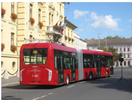
Az új trolibusz karakteres formaterve a hátfalának is jellegzetes arculatot adott