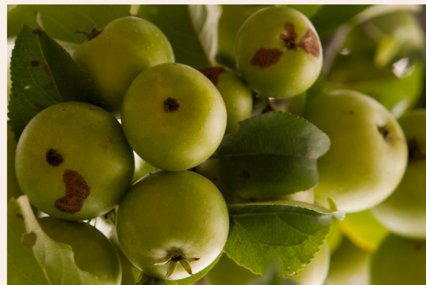
önkiszolgáló erdei büfé,