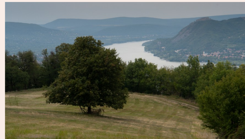
kaszáló várral és magányos fával,